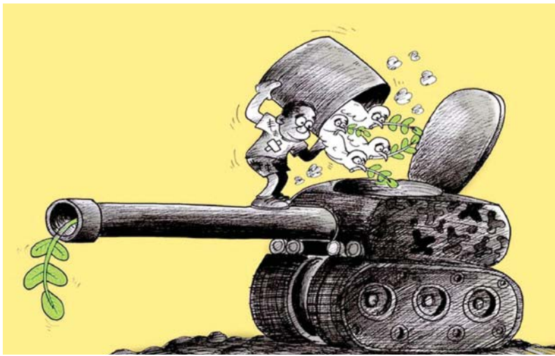
صلح و جنگ