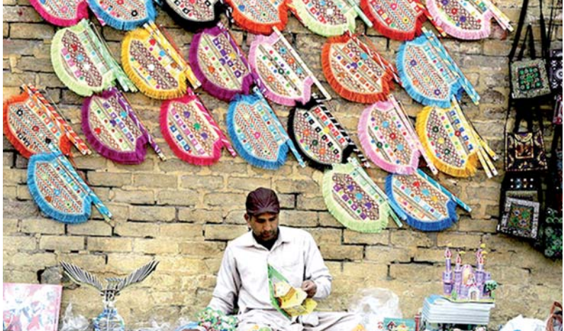
بساط دست‌فروشی در لاهور پاکستان