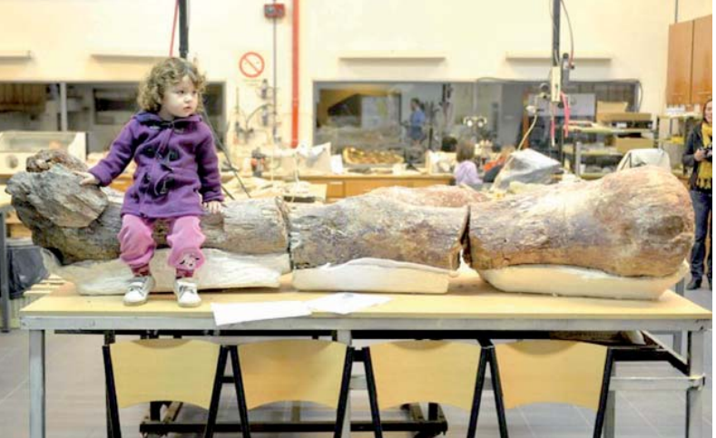
به نمایش گذاشتن استخوان بزرگترین فسیل کشف شده از یک دایناسور - آرژانتین