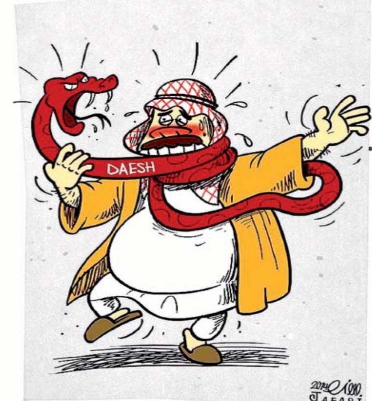
مار در آستین حکام عرب